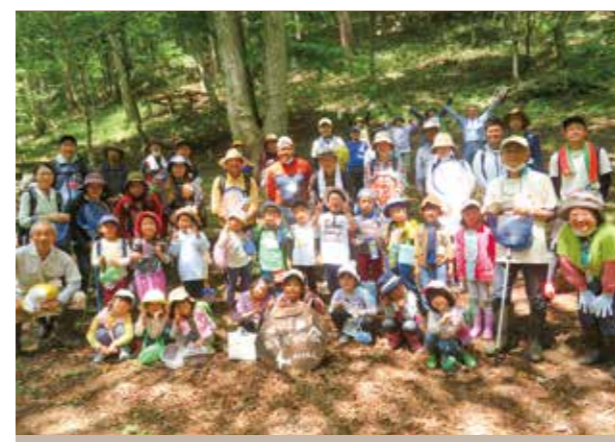
みんな笑顔で、ハイパチリ!