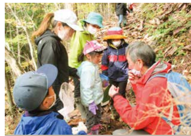
不思議なものを見つけたら、ガイドさんに聞いてみよう!

・自分のことは自分でしよう ・自分で考えよう ・自分で実行してみよう ・生き物や植物を大事に扱おう という約束事をしています。3回全てに参加する方も多く、1回目より2回目、3回目と山の斜面の上り下りが上手くなったり、小川でも自分で網を持ち川に入って水生昆虫を探したりと、積極的に行動するようになってきます。また、お父さんの参加が多く、子育てを共にしていこうという意欲が感じられうれしく思っています。