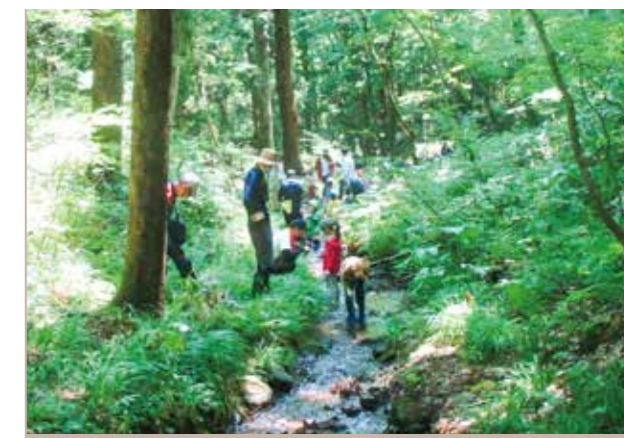
小川に入ってカニ探し