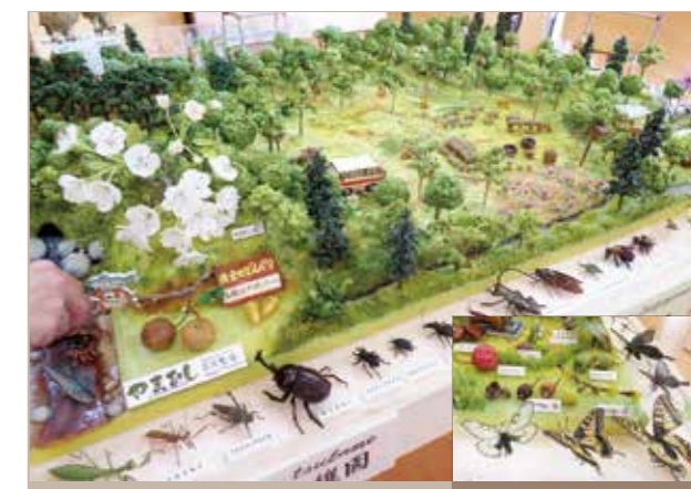
小さな子たちも楽しめるジオラマ