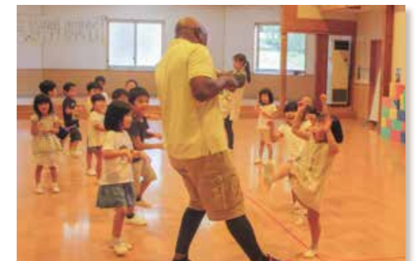
Move like a horse!