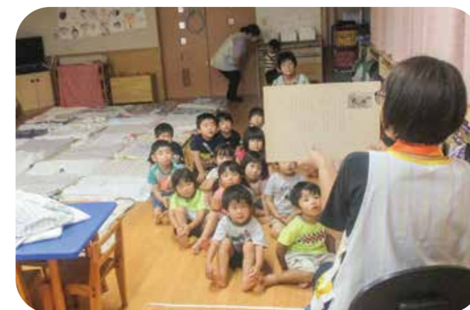
1・2号認定こどもの保育イメージ（午睡準備）