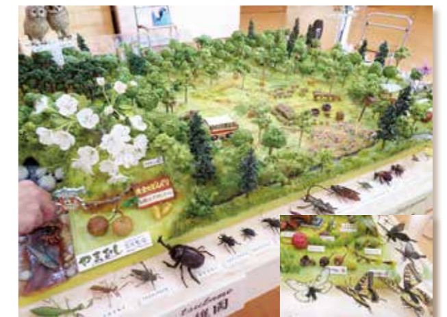
小さな子たちも楽しめるジオラマ