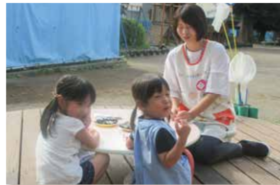
ナス漬けおいしー!