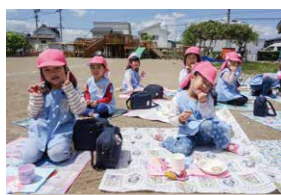
お外でいただきます!