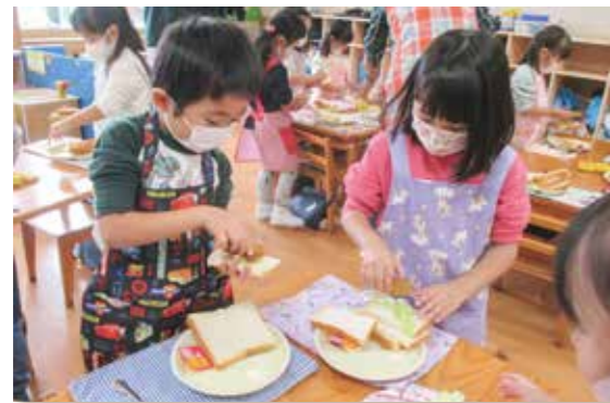
年中 サンドウィッチ作り