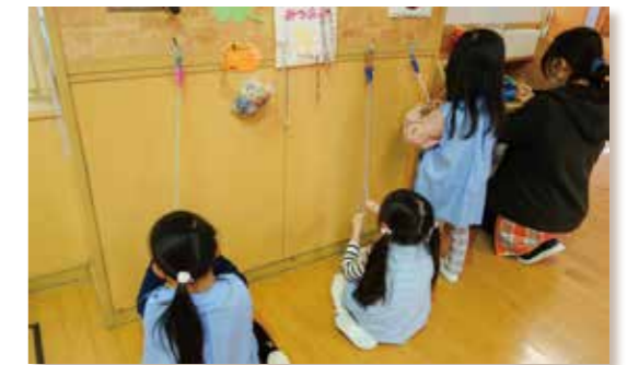
三つ編みにチャレンジ!