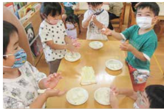
年少 おだんご作り

くっくこーなーでは遊びの時間——わくわくたいむ——の中で簡単な料理をつくることができます。興味のある子が自由に参加するため、年少組から年長組までが一緒に行うこともあります。ちょっと難しい料理の場合には年少組さんはお客さんになって、味見だけをすることもあります。キウイのヨーグルトやシソジュース作りなど、幼稚園で栽培したものを生かした料理が人気となっています。