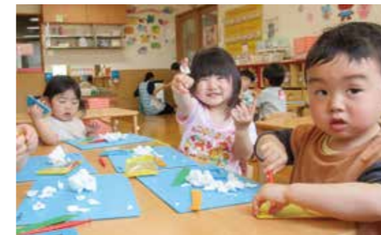
粘土でなに作ろう?