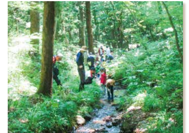
小川に入ってカニ探し