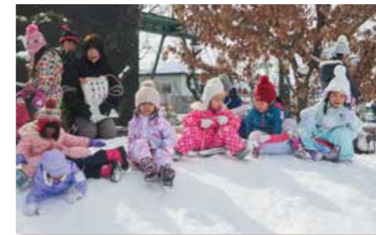
みんなで そりすべり

人間として一番大事な力 --- 自主性、集中力、創造性、 思考力、根気、忍耐力、 人とかかわる力、思いやり、 社会性、などが培われます。