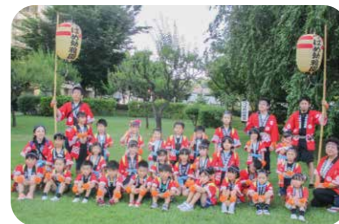
1・2号認定こどもの保育イメージ（クラス・学年活動 さんさ踊り）