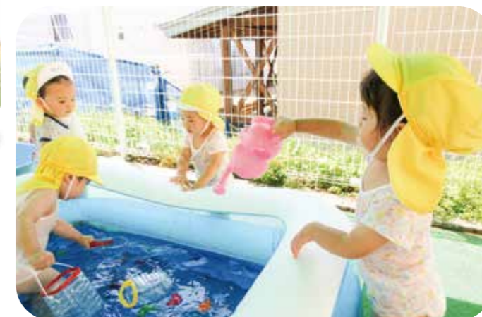
3号認定こどもの保育イメージ