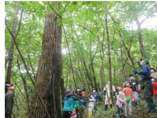
変な匂いの葉っぱやチョコボールの実、おもしろい木がいっぱいあります

希望する年長組の親子に向けて、春・夏・秋の年3回活動しています。3回全てに参加する方も多く、1回目より2回目、3回目と山の斜面の上り下りが上手くなった子、川遊びでも自分で網を持ち川に入って水生昆虫を探す子など、積極的に行動するようになってきます。参加した保護者からも「貴重な体験ができました」「次回も参加します」と好評で、卒園後の参加も受け付けています。