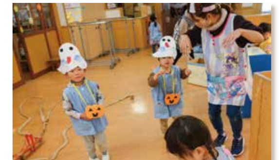
トリック・オア・トリート!