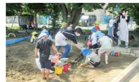
おおきな町をつくらう!

年に数回、希望する保護者の方がわくわくたいむに参加しています。折り紙や鉄棒を優しく教えてくれる先生として、またドッジボールや相撲などの相手として子どもたちに接しています。たくさんのお子どもたちと触れ合っただけだと考えております。