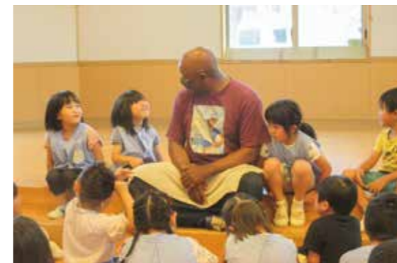
「My name is ...」