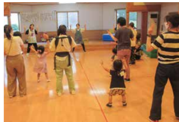
カニになりきって「おどっちゃおう♪」