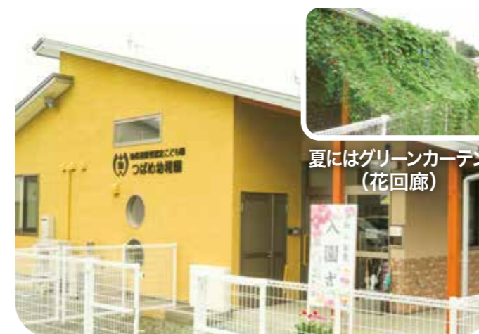
夏にはグリーンカーテン（花回廊）

2号・3号認定での入園を希望する方は、お住まいの市町村で直接入園の手続きをしてください。例年、近隣市町村では11月から12月にかけて4月の保育施設入園に関する書類の配布・申請の受付を行っています。なお空き状況により希望に添いかねる場合があります。詳細は各市町村にお問い合わせください。