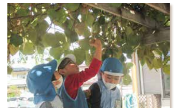
キウイフルーツの収穫