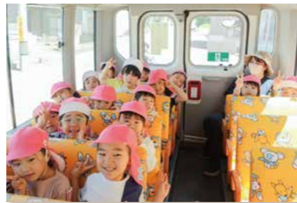
遠足いってきまーす!